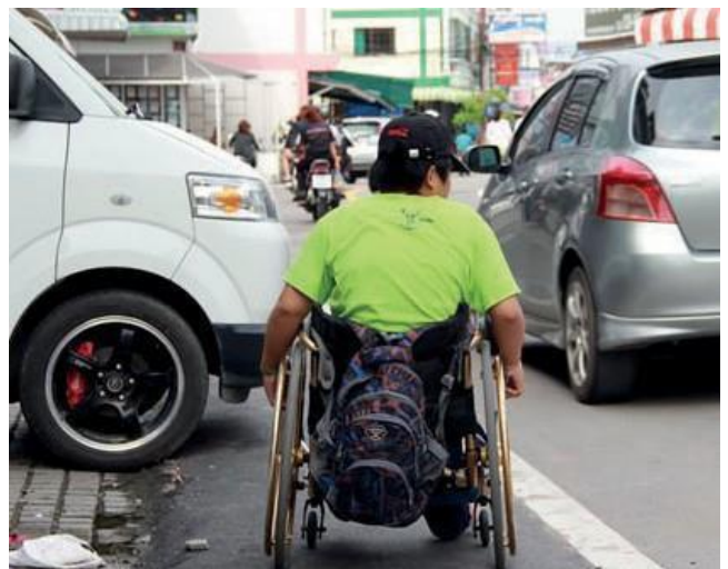
Cadair olwynion / traffig