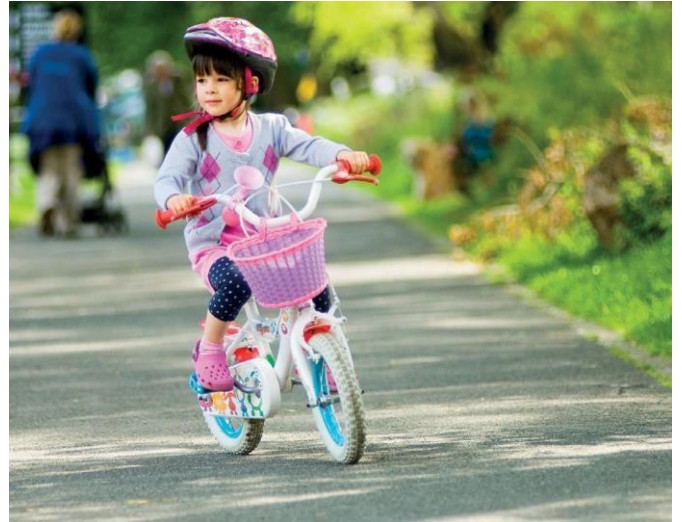
Beiciwr - plentyn