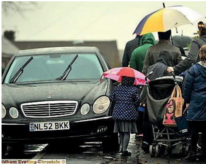
Rhiant gyda bygi